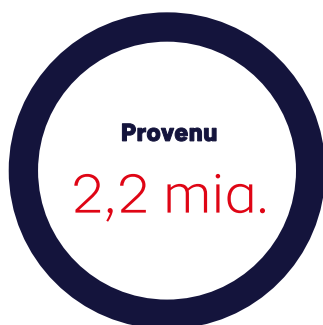
Figur 1. Nøgletal for modregning af overskydende skat i 2020

Gældsstyrelsen har inddrevet ca. 2,2 mia. kr. ved at modregne gæld i overskydende skat.