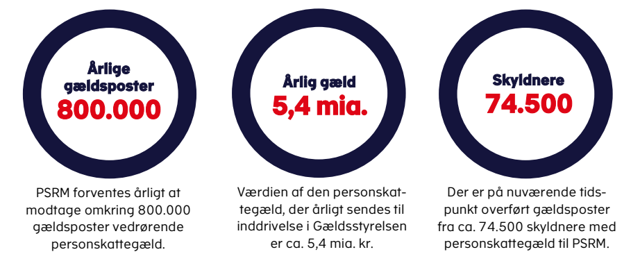
Figur 2. Nøgletal om det forventede omfang af personskattegæld i PSRM

Der oversendes i gennemsnit personskattegæld for ca. 5,4 mia. kr. om året til inddrivelse i Gældsstyrelsen. Gæld der fremover vil blive inddrevet i det nye inddrivelsessystem.