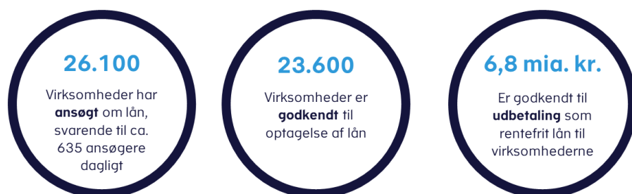
Figur 1. Status efter udløb af ansøgningsfristen

Lånene er rentefrie og løber frem til den 1. april 2021.