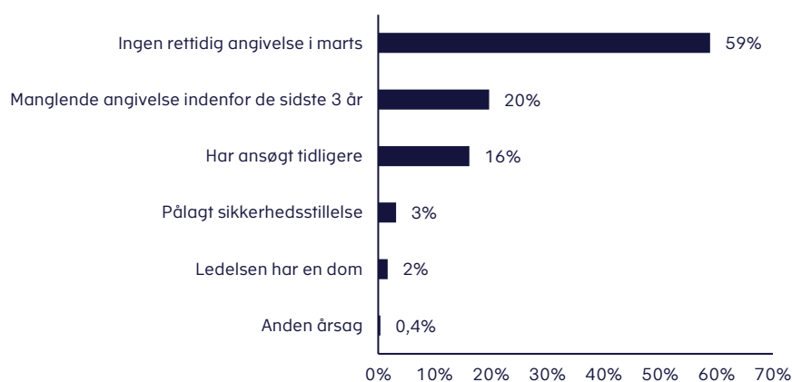
Figur 3. Årsag til afslag på lån i procent