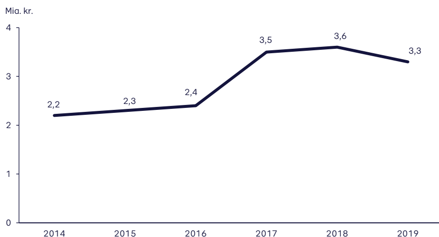
Figur 1. Udvikling i provenu fra modregning, 2014-2019

I 2019 inddrev Gældsstyrelsen ca. 3,3 mia. kr. ved at modregne gæld i udbetalinger fra det offentlige. Til sammenligning inddrev Gældsstyrelsen ca. 2,2 mia. kr. i 2014 gennem modregning, jf. figur 1.