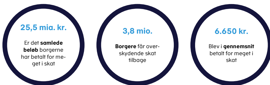
Figur 1. Nøgletal for udbetalingen af overskydende skat for indkomståret 2022.

Hver borger med overskydende skat har i gennemsnit betalt 6.650 kr. for meget.