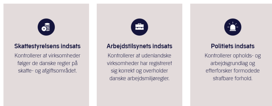
Figur 3. Eksempel på myndighedssamarbejde under fællesaktioner

Samtidig holder myndighederne tæt kontakt og underretter hinanden, hvis de på egne kontrolbesøg får mistanke om lovbrud på en af de andre myndigheders område. Samarbejdet har derfor medført, at Arbejdstilsynet, Skattestyrelsen og politiet løbende bliver bedre til at understøtte hinandens indsatser og sikrer en fortsat effektiv og målrettet kontrol.