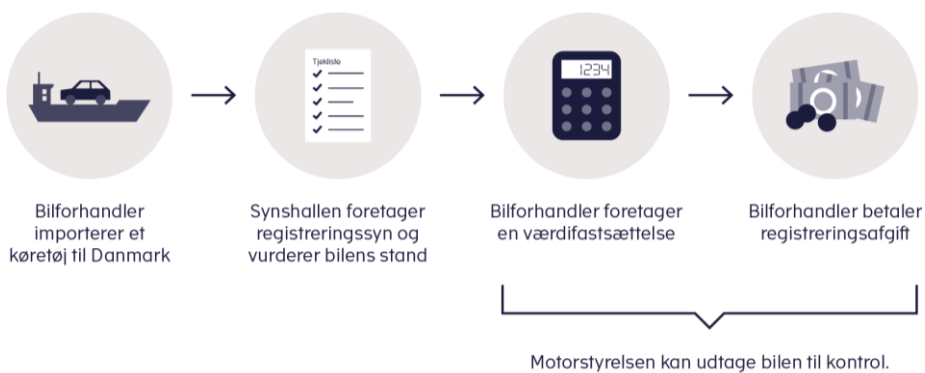
Figur 2. Overblik over processen ved import af biler

Herudover er det en del af aftalen, at Motorstyrelsen skal implementere en ny kontrol- og vejledningsstrategi på importområdet. Indsatsen målrettes virksomheder, hvor der vurderes at være størst risiko for udfordringer med værdifastsættelsen.