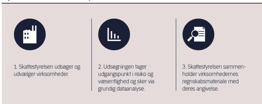
Figur 2. Sådan udfører Skattestyrelsen kontrollerne

Af figur 2 fremgår forløbet, som beskrevet ovenfor.